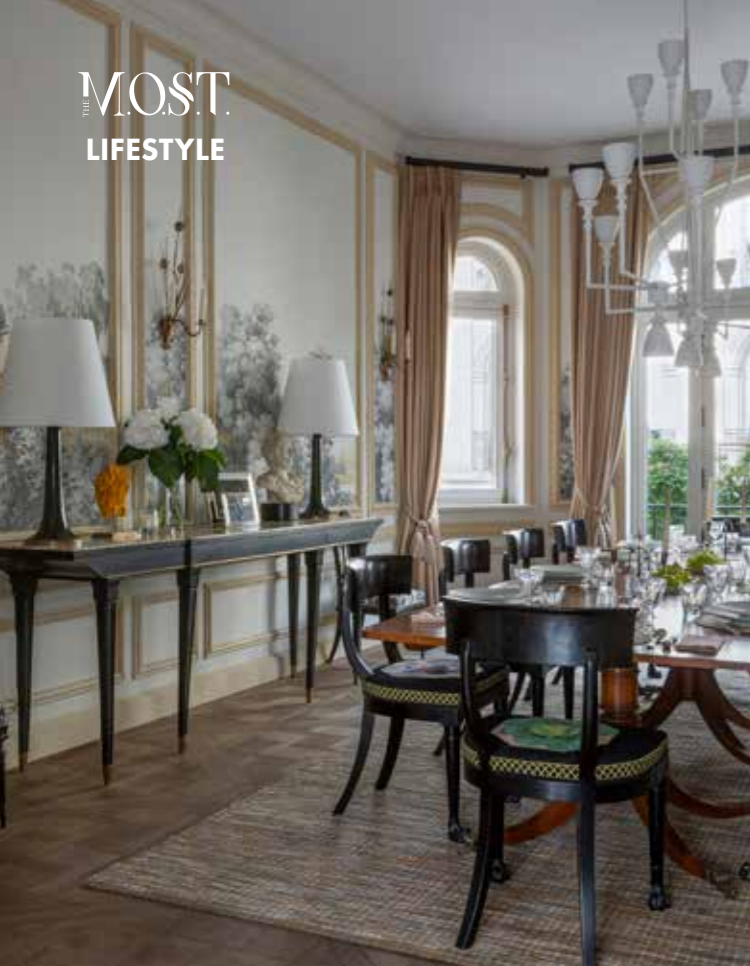
На этой странице и далее: фотографии интерьера особняка, расположенного в 16-м округе Парижа, построенного в XIX веке архитектором Анри Дегланом, автором парижского Большого Дворца, и отреставрированного Брайаном О'Салливан